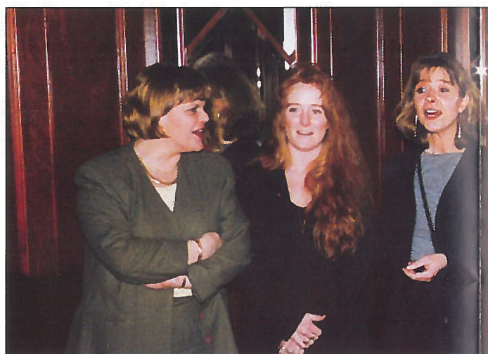
«Freske» damer bidro med sang under festmiddagen.

wing selskapet måtte vi endre på teksten i vedtektene. Ny tekst ble da: Norsk Helikopteransattes Forbund har som formål å organisere ansatte i selskaper/konsern som driver helikopter virksomhet i Norge.