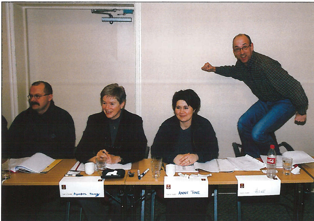
Engasjerte deltakere under rep.møtet.

NHF avholdt sitt årlige rep.møte på Ernst Park hotell i Kristiansand 18.-20. februar. Styret, samt 19 delegater fra 3 forskjellige helikopterselskaper møttes 18. februar i en snødekt sørlandsby.