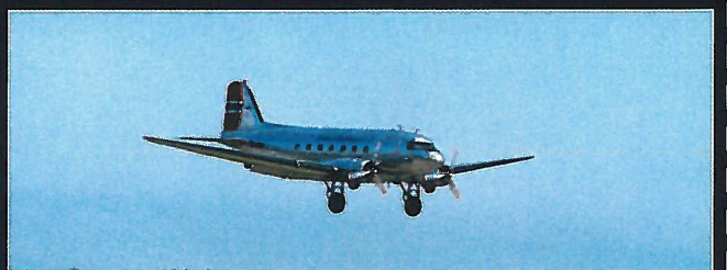
DC3 inn for landing.