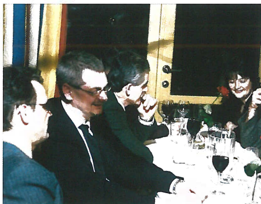
Sosialt samvær er også en del av det årlige møtet.

Budsjettet ble øket med 30 000 under posten lønnskostnader refundert arbeidsgiver, og øket 25 000 på posten reise, diett oppholdskostnader. Budsjettet vil da ha et resultat på – 225 000 kroner.