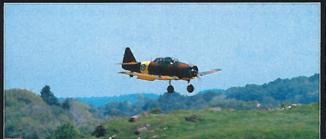
Harvarden inn for landing