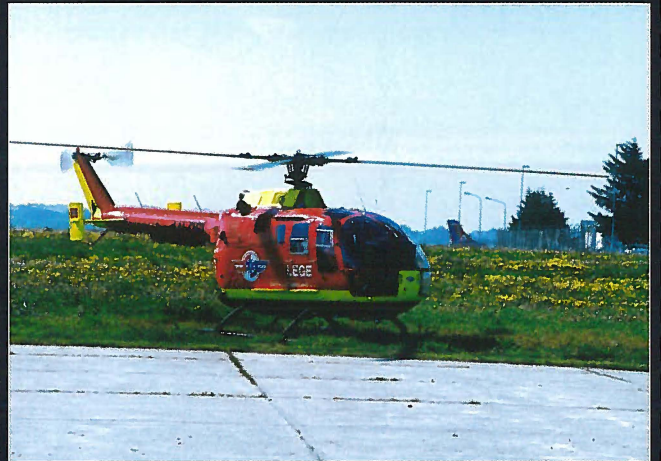
Norsk luftambulanses BO 105 nettopp landet.