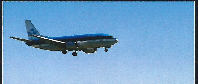
KLM over Sola.