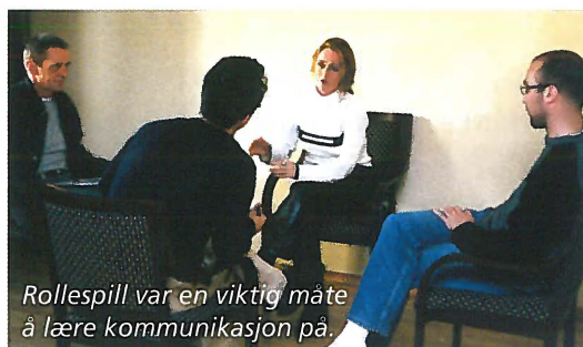
Rollepill var en viktig måte å lære kommunikasjon på.

Første dag hadde vi en introduksjon med presentasjon av kurset, rammer, deltagere, forventninger og en oppsummering fra forrige teambuilding. Kvelden ble avsluttet med en god middag.