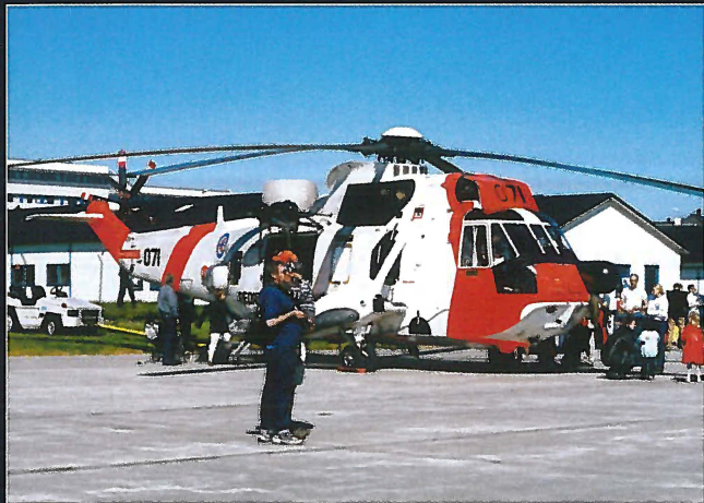
Forsvarets Sea king