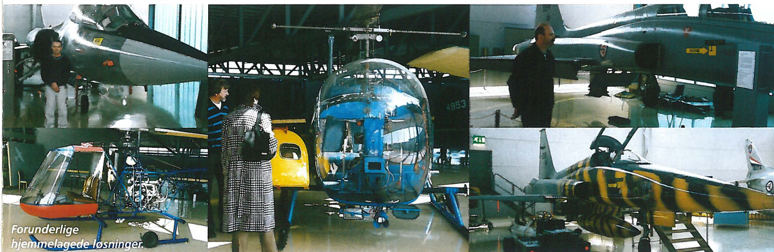
Forunderlige hjemmelagede løsninger.

Under er noen bilder fra vårt besøk på Flymuseet på Gardermoen