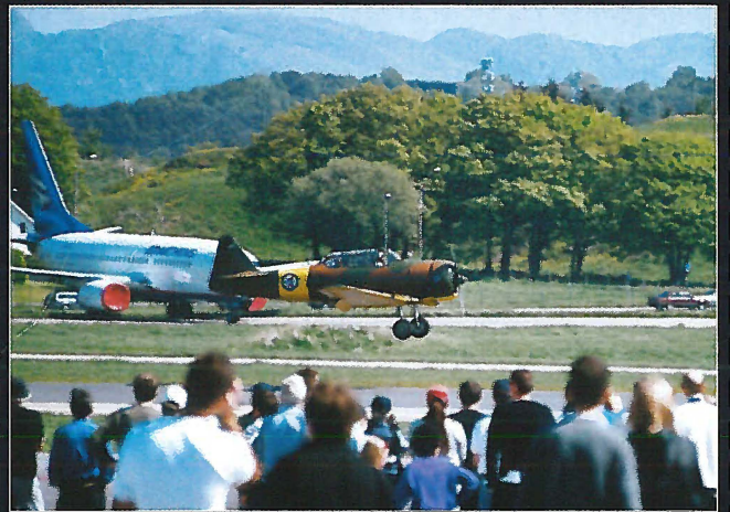
Harvard inn for landing.