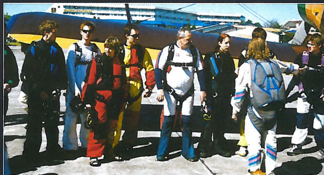
Forberedelse til hopp fra russermaskinen.