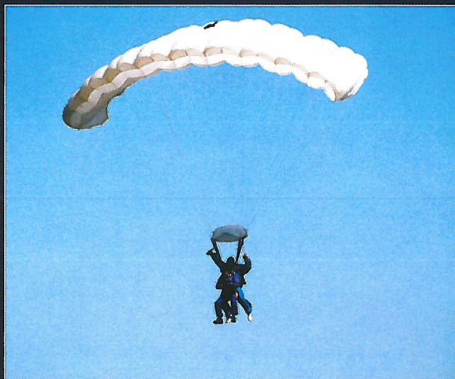
Formannen i Sola Flyklubb får seg her et gratis tandemhopp.